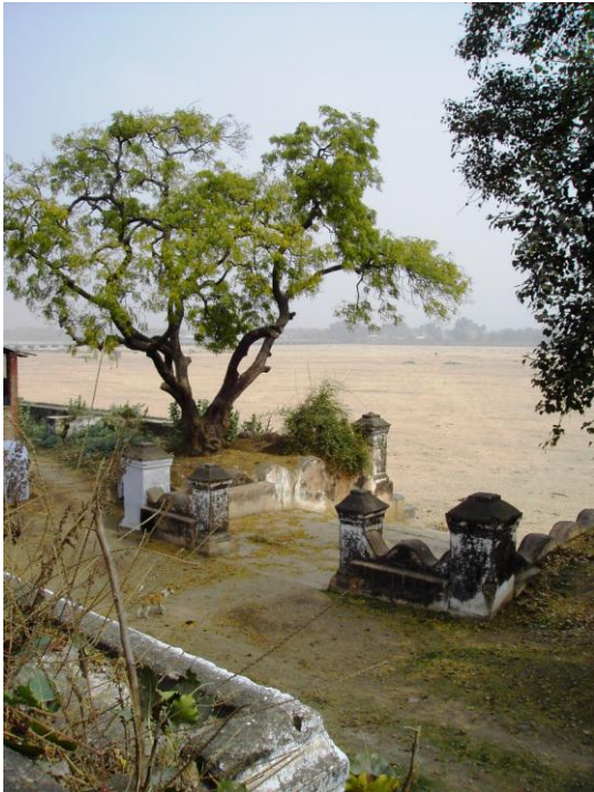
Flussbett des Naranjana-Flusses bei Bodhgaya, Indien

Kisa Gotami war die Tochter eines armen Mannes. Sie hatte ein freundliches Wesen und von Kind an die Fähigkeit, alles im Leben positiv zu sehen. Eines Tages lernte sie den Sohn eines Kaufmannes kennen und da die Eltern einwilligten, heirateten sie. Kisa Gotami war fröhlich und immer gut gelaunt, denn sie hatte in ihrem Leben noch nie ein größeres Leid erfahren. Deshalb war sie sehr beliebt und die Kunden kamen gern. So ging es ihnen gut und sie waren angesehen und wohlhabend.