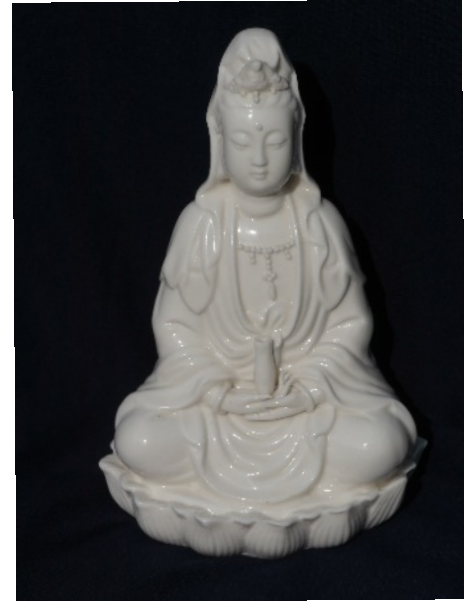
Aus Avalokiteshvara wird in China Quan Jin (Guanyin), eine weibliche Erlösungsfigur mit haubenähnlicher Krone. Zeitgenössische Porzellanfigur aus China