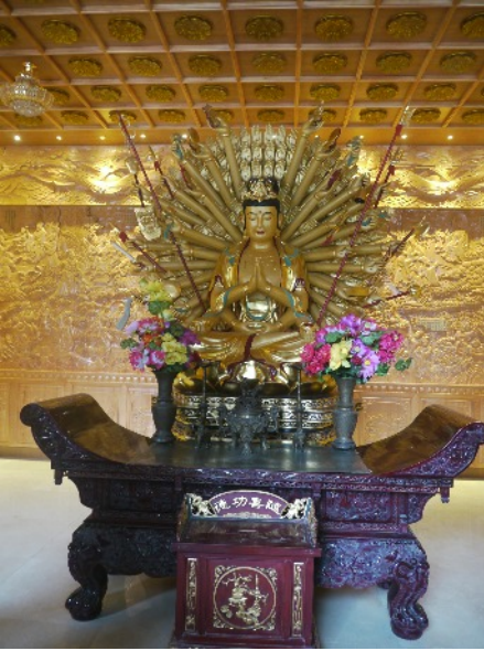
Bodhisattva Avalokiteshvara mit vielarmiger Hilfsbereitschaft, VR China, Xi'an, Grosse Wildganspagode