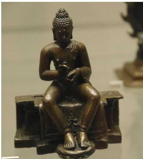
Predigender, westlich sitzender Buddha, Zentral-Java, 9. Jh. u. Z., Museum für Asiatische Kunst, Berlin