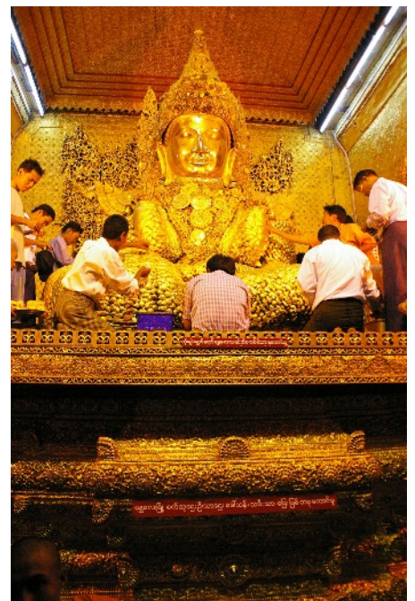
Am goldbedeckten Mahamuni-Buddha in Mandalay, Myanmar