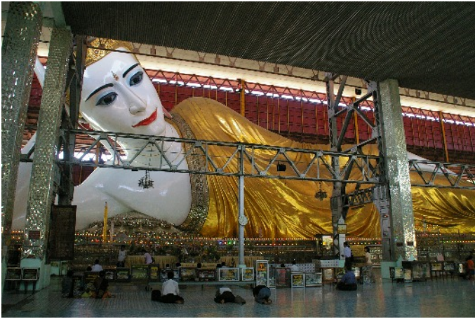
Liegender Buddha von Chaukhtagyi in der Chaukhtaugyi Paya in Yangon, Myanmar (Burma)