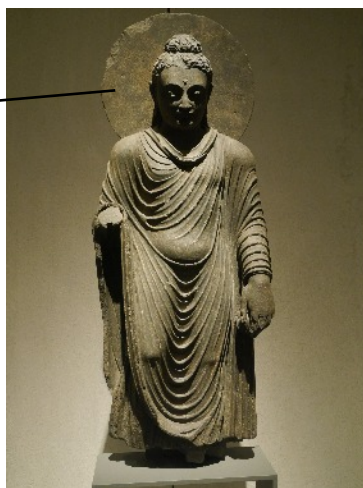
Bild oben: Tibetische Buddha-Figur Bild unten: Stehender Buddha, Gandhara, Takht-i-Bahi, 2./3. Jh. u. Z., beide Figuren: Museum für Asiatische Kunst Berlin