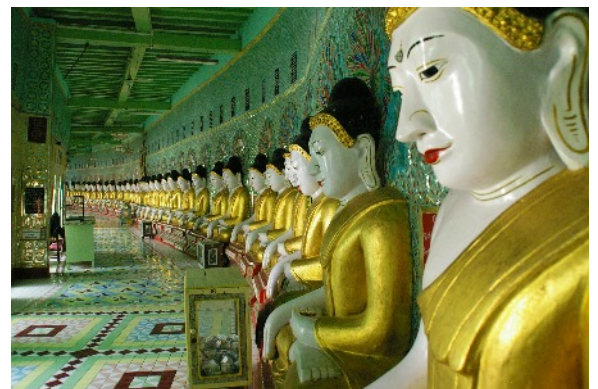
Reihung von Buddhas am Mandalay Hill, Myanmar