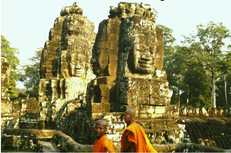
Gesichter-Türme am Staatstempel Bayon mit Gesichtern des Bodhisattva Avalokiteshvara, Angkor Thombei, Siem Reap, Kambodscha