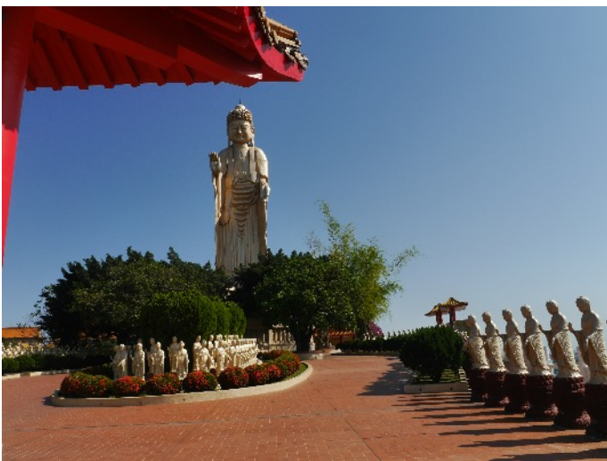
Statue im "Land des großen Buddha", Fo Guang Shan, bei Kaoshung, Taiwan