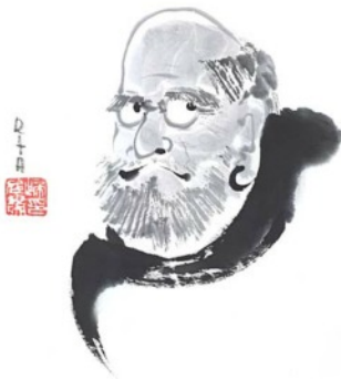
Das Bildnis des Daruma von der Sumi-e Meisterin Rita Böhm