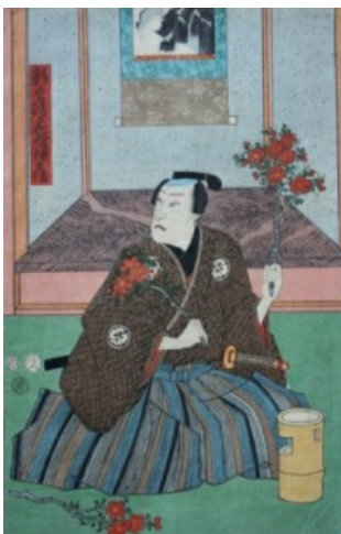
Toyokuni III., Samurai beim Blumenarrangieren, Ausschnitt aus einem kabuki Farbholzschnitt, 1854