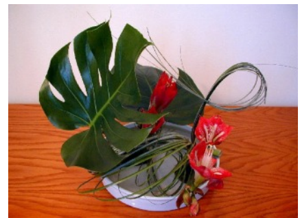
Die Fotos 2-3, 5-6: Weil Das Foto 1: Wikipedia: Shodo; Bild 4: /www.sumi-e-berlin.de/de/zen-impressionen/ Bilder 9-10: wikipedia: Ikebana